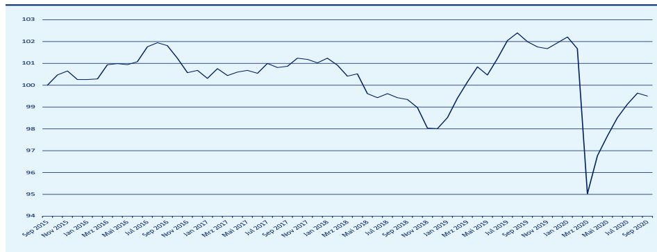
■ BayernInvest Total Return Corporate Bond Fonds